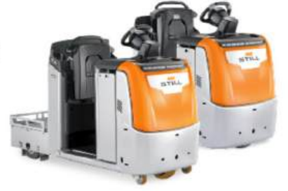
LTX 50 / LTX-T 06