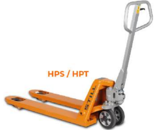
HPS / HPT